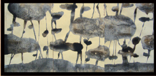
作品 E-3 24cm × 50cm