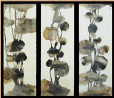
作品 H-1, 2, 3 47cm × 18cm (54cm)